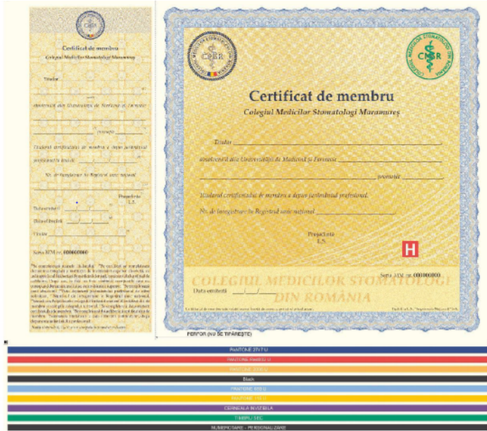
Verso - anexa 1